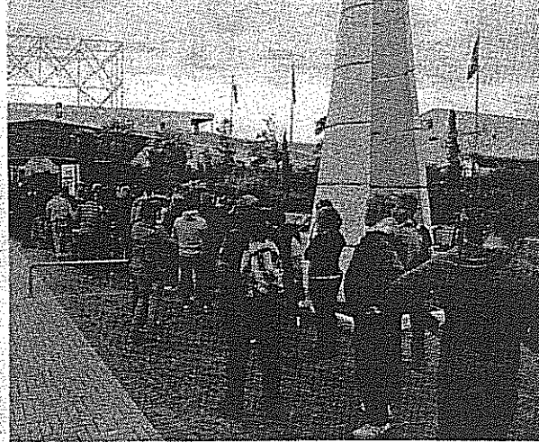
Sopra l'esibizione di un centauro, nella foto accanto invece le code ai botteghini per entrare in Fiera