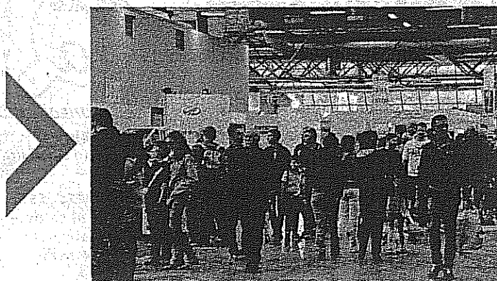
Il plenone negli stand di Carrara Fiera