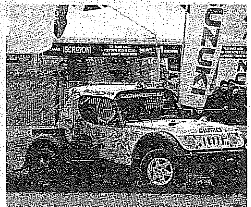
Un'esibizione all'interno di 4x4