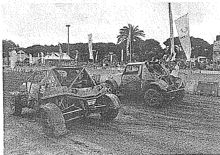
Anche i quad si potranno ammirare tra gli stand

Parte domani la tre giorni dedicata a suv, jeep e motocross E in questa edizione verrà coinvolto anche il centro storico